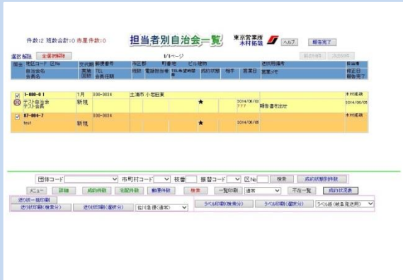
担当者登録の画面