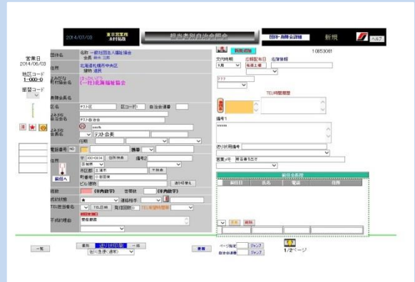
担当者案件照会の画面